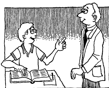
El "enfoque de descubrimiento" procura dirigir al alumno a descubrir la verdad por sí mismo.

Observe el diferente hincapié que se hace en este segundo enfoque: el maestro le enseña a una persona en lugar de enseñar simplemente una lección. Los elementos importantes son el alumno y los resultados del aprender. Este método de enseñanza exige que el maestro dirija al alumno en el proceso de aprender. Los que sostienen este enfoque no comparan el llenar la mente del aprendiz con conocimiento con el aprender significativo; creen que el maestro puede y debería ayudar al alumno a descubrir y aplicar la verdad. Por eso, a este punto de vista se le llama enfoque de descubrimiento o aprender por descubrimiento.